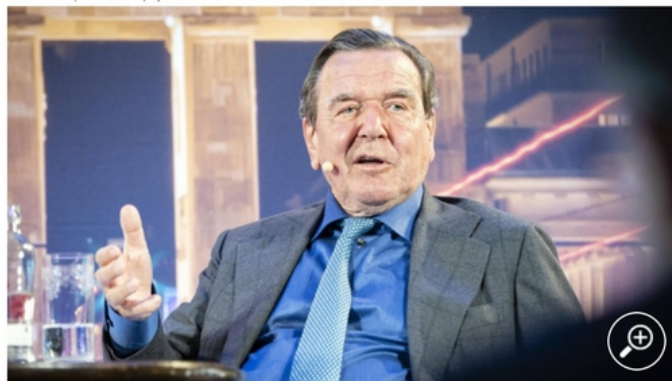
Gerhard Schröder. Der Alt Bundeskanzler attackiert Corona-Demonstranten.