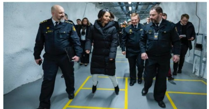
Bei ihrem Besuch in einem Bunker unter Helsinki („Arena Center Hakaniemi“) spielt Außenministerin Annalena Baerbock (42, Grüne) im Vorbeigehen ein Hüpfspiel