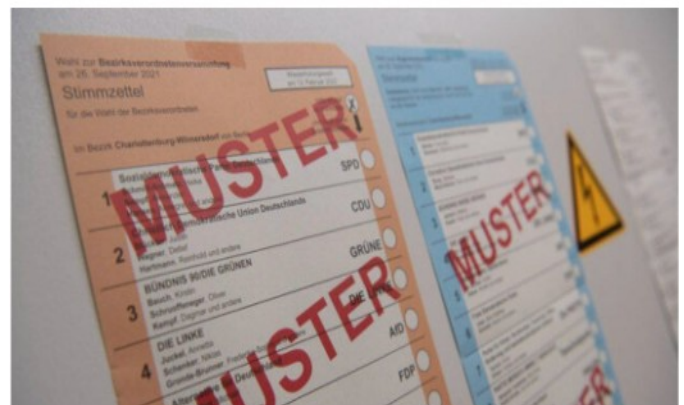
Aushang in den Wahllokale vergangenes Sonntag

In vorläufigen Ergebnissen der Berlin-Wahl tauchen mehr Stimmen als Wähler*innen auf. Der Wahlleiter kann keine konkrete Erklärung dafür liefern.