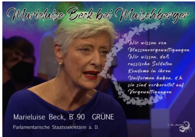
Der Skorpion 43

Def: Was ist ein Narzisst? Menschen mit einer narzisstischen Persönlichkeit haben ein extremes Bedürfnis nach Aufmerksamkeit, Anerkennung und Bewunderung. Oft stechen sie durch Arroganz und Selbstidealisation heraus. Kritik ertragen sie nicht, und Misserfolg kann sie in schwere Krisen stürzen.