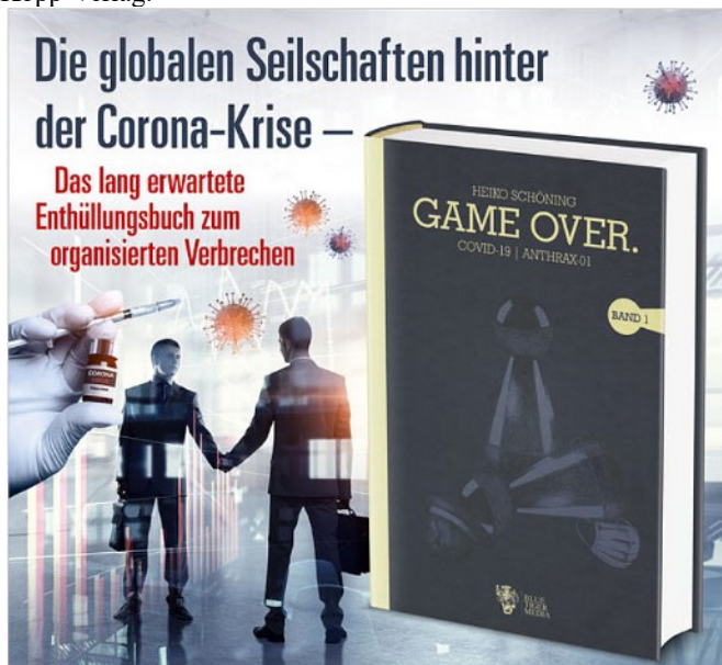
Screenshot aus der Seite des Koppverlages