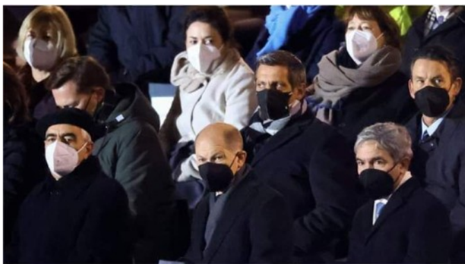
Ein geladen waren die Minister aus 16 Jahren Merkel-Kanzlerschaft und ihre engsten Mitarbeiter