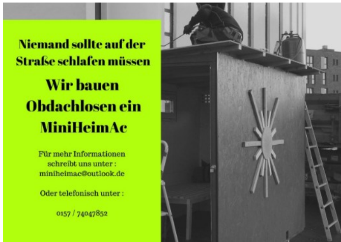
Markus aus Aachen