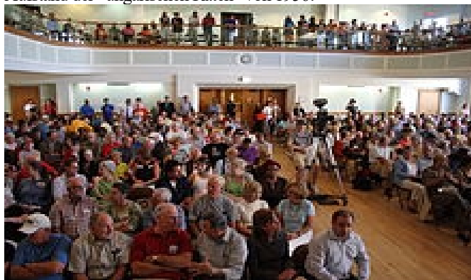
(A town hall meeting in West Hartford, Connecticut)

einen anschaulichen Bogen von den "Town Hall Meetings" der amerikanischen Revolution 1763-75, über die "Pariser Kommune und ihre Sektionen" von 1789-93, zu den Sowjets der Russischen Revolution 1917-18, der Münchner Räterepublik von 1919 und den Aufstand der "ungarischen Räten" von 1956!