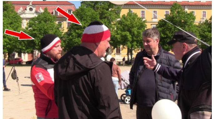
Abwehr einer Provokation auf dem Domplatz (siehe rote Pfeile)

den Kaiser zurückhaben zu wollen (Monarchisten), eine Veranstaltung der Basis „besuchen“ zu müssen.