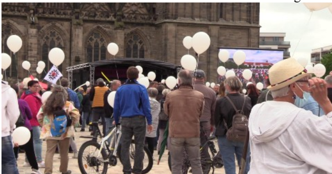
Blick zur Bühne, aus der Mitte der Besucher

Nach unserer Schätzung versammelten sich ca. 3000 Menschen auf dem Domplatz. Die Polizei ließ die Versammlung gewähren. Natürlich nicht ohne ständige Unterbrechungen des Programms für Ermahnungsansprachen für Abstands- und Maskenauflagen, die sich immer sehr gut nutzen lassen wenn es darum geht Veranstaltungen der Opposition zu stören. Menschen sind soziale Wesen und wenn ihnen paternalistisch „zum Schutz ihrer Gesundheit“ asoziales Verhalten befohlen wird, ist Widerstand ganz natürlich. Die Polizei ist völlig frei, zwischen brutaler Räumung und gnädiger Gewährung zu entscheiden. Sie hat sich für Gnade entschieden und es herrschte Volksfeststimmung.