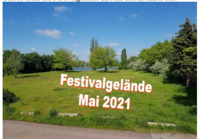
Foto vom 30.05.2021- Blick auf das Festivalgelände

Und so sieht das Festivalgelände im Mai diesen Jahres aus: