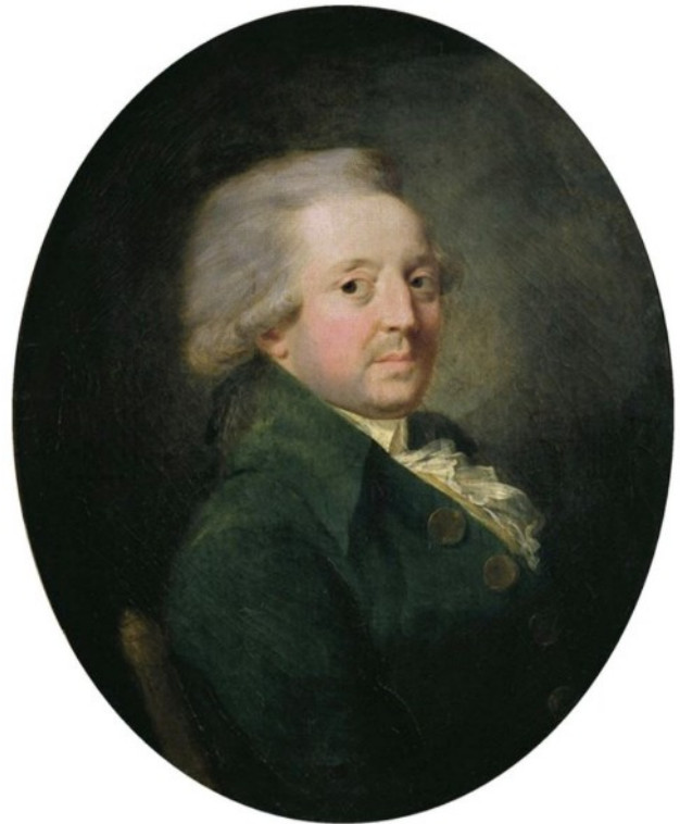
Marie Jean Antoine Nicolas Caritat, Marquis de Condorcet (1743–1794)

Der Freiheitsbegriff ist sehr eng mit dem Begriff der Gleichheit verbunden, denn alle Menschen sind gleich