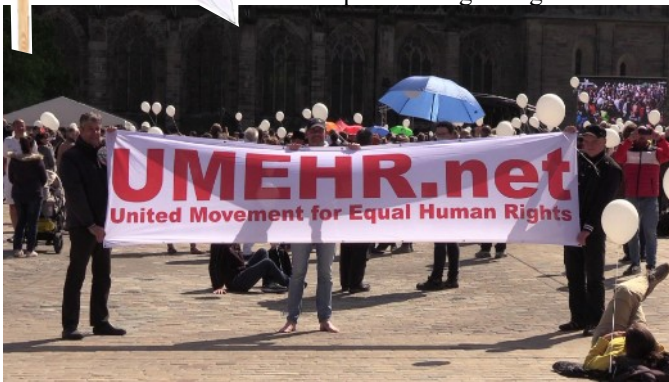
Foto auf dem Domplatz, mit dem UMEHR-Banner

gegründete Verein UMEHR (siehe https://www.umehr.net/ ). Unsere Treffen für die organisatorischen Verabredungen fanden am 29./30.05.2021 in Magdeburg statt. Am 29.05.2021 besuchte eine Abordnung des Teams die Veranstaltung „Richtungswechsel mit der Basis“, der neu gegründeten Partei dieBasis , auf dem Domplatz in Magdeburg.