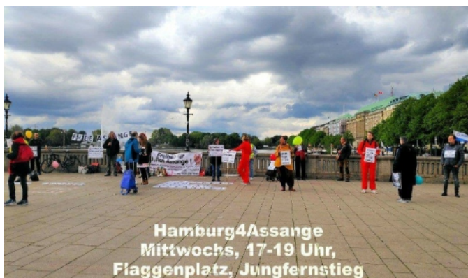
Hamburg4Assange Mittwochs, 17-19 Uhr, Fiaggenplatz, Jungfernstieg

- Gesundheit, - Ökonomie, Demokratie, Medien sowie Krieg und Frieden