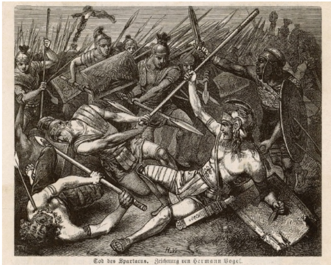
Tod des Spartacus. Zeichnung von Hermann Vogel.

Theseus meldete sich freiwillig und versprach dem Unrecht ein Ende zu setzen. Auch die Heldin von Suzanne Collins, Katniss, meldet sich freiwillig, aber hat zu diesem Zeitpunkt noch nicht vor, einen Aufstand vom Zaun gegen die Fremdherrschaft durch die Bewohner des Kapitols zu brechen. Spartacus hingegen ist eine reale Gestalt und aufständischer Sklave gegen ein Imperium. Er kämpft gegen reale Menschen und nicht gegen Fabelwesen, erst in der Arena gegen seines Gleichen und dann gegen die Unterdrücker, genau wie Katniss. Damit verließ die Autorin die mythische Ebene und näherte sich der Realität und Gegenwart an.